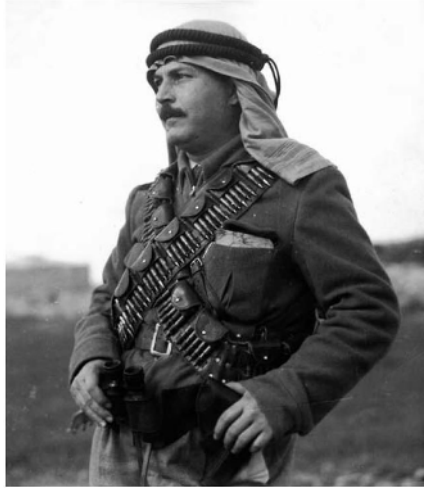
(‘Abd al-Qadir al-Ḥusaynī, wira Palestin)

Deir Yassin merupakan mangsa termudah bagi tentera Irgun. 3 Tambahan kepada ini, para pasukan tentera zionis memerlukan sebuah kawasan lapangan terbang untuk kegunaan penduduk al-Quds. Serta serangan, pembunuhan beramai-ramai, dan pemakluman berkenaan pembunuhan ini merupakan salah satu daripada rencana am yahudi untuk mengosongkan Palestin daripada penduduk asalnya melalui cara pembasmian dan pengusiran. Perkampungan (Deir Yassin) yang kecil ini didiami sekitar 400 orang penduduk, di mana mereka mencari kehidupan dengan berniaga dengan kampung-kampung di sekitarnya. Mereka hanya memiliki