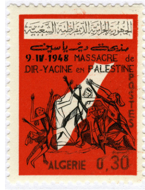
(Setem yang dikeluarkan Kerajaan Jordan dan Republik Algeria pada 1965, tanda solidariti dan kenangan kepada peristiwa pembunuhan Deir Yassin)

Meir Pail, seorang zionis sosialis pada 70-an lalu telah mengakui bahawa pembunuhan Deir Yassin merupakan sebahagian daripada perancangan am Pelan Dalet, di mana ia disetujui oleh kesemua organisasi zionis pada Mac 1948. Ia bertujuan untuk mengusir keseluruhan rakyat Palestin daripada bandar-bandar dan kampung-kampung Arab sebelum Britain mengangkat kakinya (daripada Palestin), dengan menggunakan cara pemusnahan, pembunuhan, dan menyebarkan ketakutan dalam kalangan rakyat Palestin; hal ini yang mendorong mereka untuk meninggalkan kediaman mereka. Oleh kerana itu, tidak dihairankan, dalam tempoh tiga hari selepas peristiwa pembunuhan ini, kampung Deir