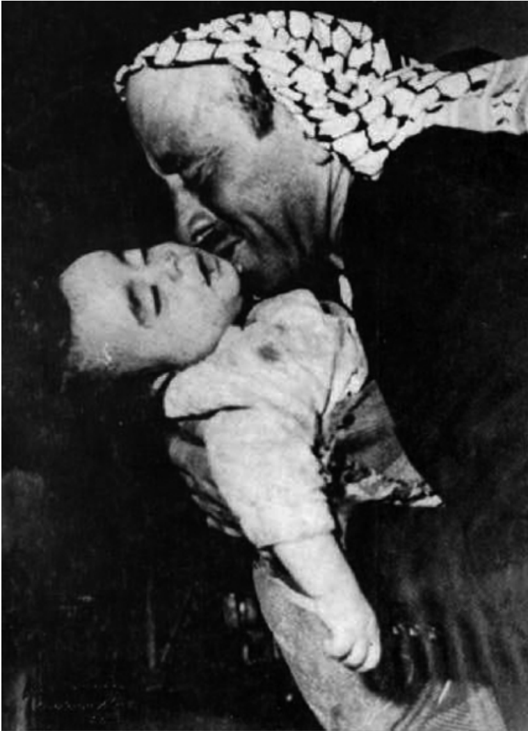
(Seorang ayah memeluk jasad anaknya yang tak bernyawa, salah seorang korban pembunuhan zionis di Deir Yassin)