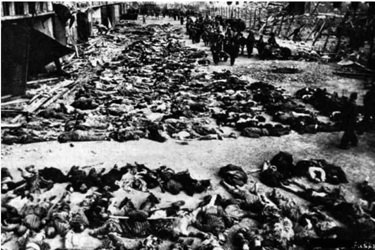
(Syuhada' Deir Yassin)

ketat sekali dengan tujuan untuk menyembunyikan bukti jenayah. Seperti dikatakan Mercier, “Di dalam beberapa minit sahaja, berdepan dengan penentangan yang tak pernah dialami mereka, para belia dan beliawanis Irgun dan Stern berubah menjadi tukang sembelih. Mereka membunuh dengan kejam dan tanpa berhati perut, serta teratur pula, sepertimana yang pernah dilakukan oleh tentera nazi.”