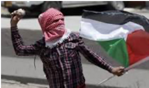
( Atfāl al-Hijārah , simbol perjuangan Palestin melawan penjajahan)

Yang Maha Memberi Kemenangan dan Maha Membantu, tidak kepada selain-Nya. Dengan ini, situasi berubah, kita mulai melihat perkara yang diimpikan pada 1967 (yakni kemenangan umat Islam). Berlakulah peristiwa Perang Karamah ( Battle of Karamah 1968 ), kemudian Perang 10 Ramadan 1973 ( Yom Kippur War 1973 ), dan kebangkitan Islam mula menyala dalam masyarakat Arab, kerana ia sudah mengetahui bahawa slogan-slogan yang dijulung tidaklah hanya menjadi kerugian. Cahaya kemenangan bersinar semula pada perjuangan Atfāl al-Hijārah (kanak-kanak yang membaling batu ke arah zionis) yang mengembalikan kemuliaan umat Islam, dan membuktikan kepada dunia bahawa setiap peristiwa peringatan terhadap kekalahan yang bersilih ganti bahkan menambah lagi kemarakan semangat bangsa yang ingin beroleh kemenangan yang dijanjikan.